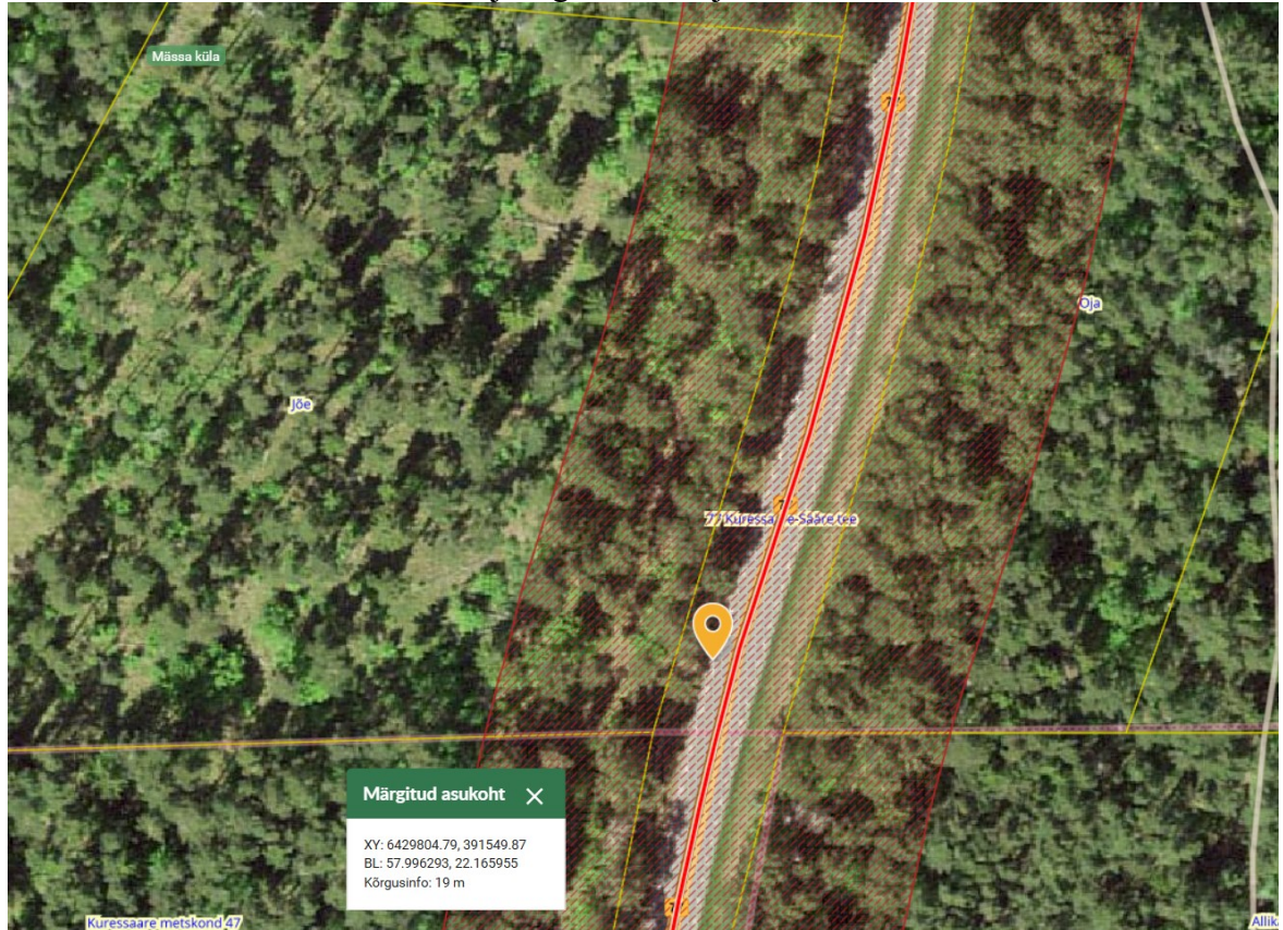
Joonis 1. Ristumiskoha asukoht tähistatud oranži tingmärgiga.